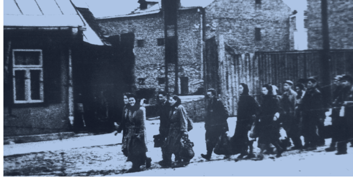
Arbeitskolonne auf dem Rückweg ins Ghetto von Kaunas um 1942

Konzertprogramm mit Texten und Liedern aus dem Wilnaer Ghetto sowie verschiedenen Benefizveranstaltungen. Um eine regelmäßige Hilfe auch weiterhin leisten zu können, ist der Verein auf neue Mitglieder und auf jede Spende dringend angewiesen.